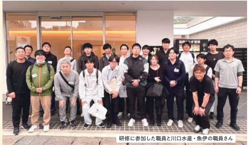
研修に参加した職員と川口水産・魚伊の職員さん