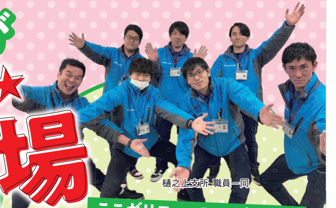
樋之上支所職員一同