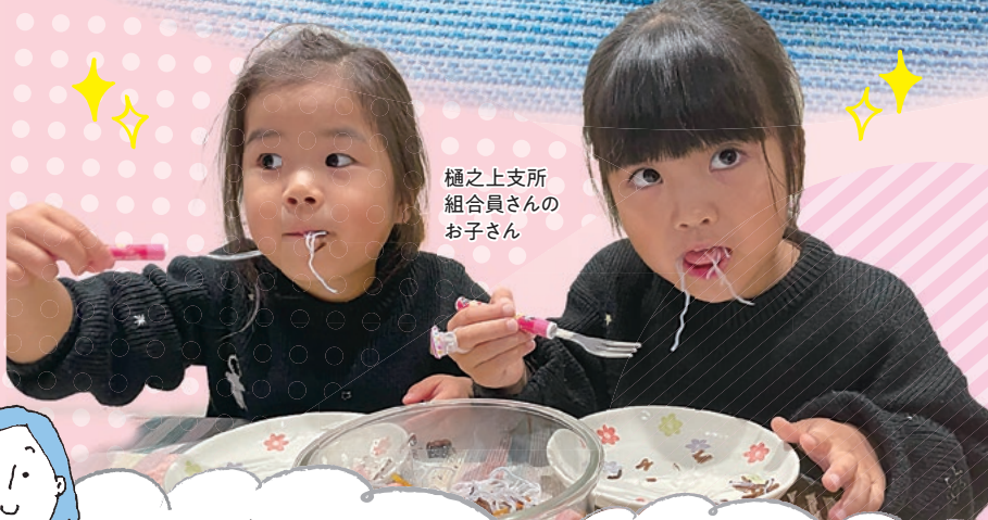
樋之上支所 組合員さん のお子さん