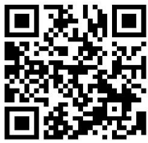
2次元バーコードからメールで申込みできます

■受付させていただいた個人情報に関してはこの取組み以外に 使用いたしません。 ■1 当日午前7時の時点で開催市町村または見学前に暴風警報 ・大雨洪水警報が発令された場合、中止となります。 7時以降に発令された時点でも中止となります。 2 当日大阪府下または見学前に震度5以上の地震が発生した場合 中止となります。 3 その他パルコプが危険と判断した場合、中止となります。 ※1~3の「中止」のお知らせはホームページでもお知らせします。 ■ 視覚・聴覚に障がいをお持ちの方はガイドヘルプ・手話ボラン ティア制度を利用し参加することができます。事前にご連絡 ください。