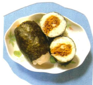
⑥ 焼きソバ 玉ねぎ