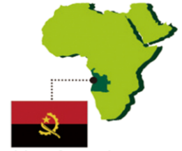
Republic of Angola アンゴラ共和国