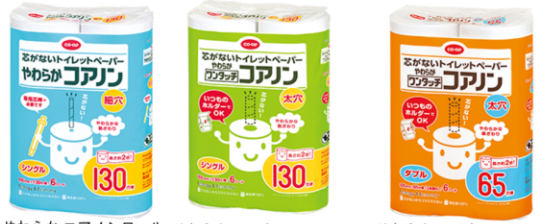
やわらか コアノンロール シングル 130m×6ロール やわらか ワンタッチコアノン シングル 130m×6ロール やわらか ワンタッチコアノン ダブル 65m×6ロール