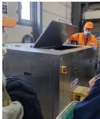
微生物の力で水と炭酸ガスに分解野菜の葉ケス等を処理しています。

見学会に参加させて頂いたこと、とてもありがとうございました。 まず、建物に驚きました。多くの組合員さんの需要に対応べく、自動化されたラインで昔と異なり、作業を自動化しています。 仕事をされている方が、とても良い感じでした。 又、このような機会があるのはいいと思います。私のリサイクル等、協力をさせていただきます。