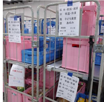
子供食堂に届ける商品ケースです。(ピンク色です)