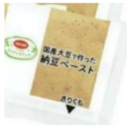
国産大豆で作った納豆ペースト