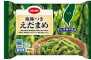
塩味つきえだまめ 冷凍（自然解凍）