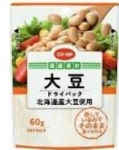
大豆ドライパック