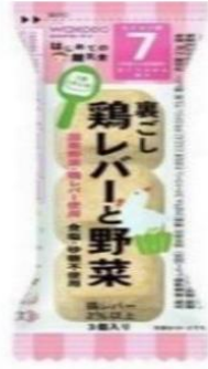
裏ごしレバーと野菜 フリーズドライ3個入 賞味期限一年