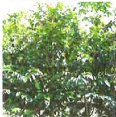
③順調に育てば、植え替えをして2～3年目で農作物として収穫できます。その後10年間ほど収穫が可能です。