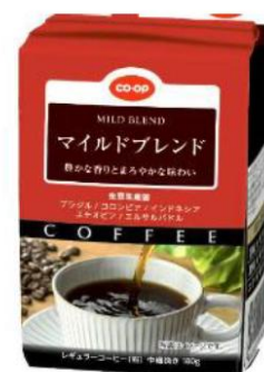
コープきんき 共同開発品 マイルドブレンド(中細挽)