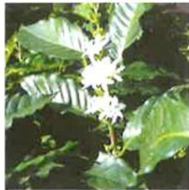
②コーヒーの花は、降雨の後に一斉に咲きます。花は白く、ジャスミンに似た香りがします。