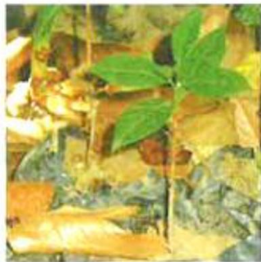
①種子を蒔き、約50日～60日で発芽。苗床で8～12ヶ月間育てられた後は、農園に植え替えられます。