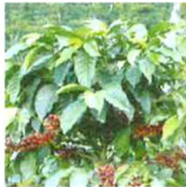
④青い実が成熟すると、サクランボのように赤く色づきます。収穫は、主に乾季の頃に低地から行われます。