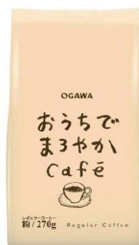
おうちでまるやか Cafe