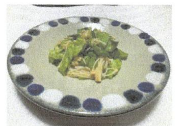
えのきとレタスのたらこあえ お酒にあいそう