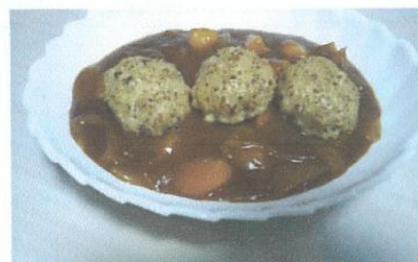
ビーフシチューに 乗せて肉を 煮込まずに らくちんメニューに