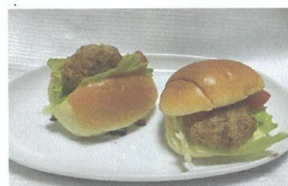
コープ商品の バターロールで ハンバーガーに