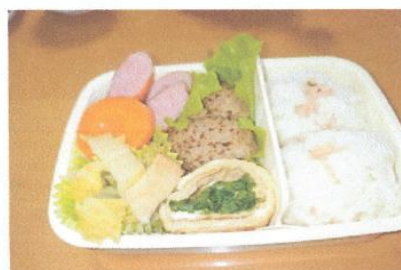
お弁当の メインおかずに