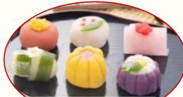
新春の上生菓子(六花)