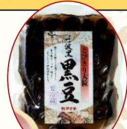
丹波黒黒豆 極大粒