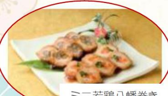
ミニ若鶏八幡巻き ・二色セット