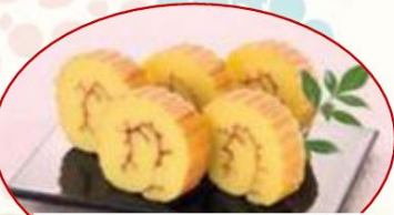
COOP 甘さひかえめ伊達巻