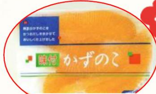
生協味付け数の子