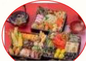
生協オリジナルおせちセット