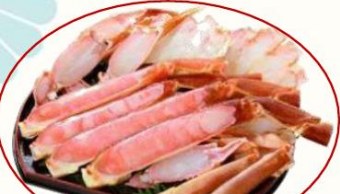
生ずわいがに(大) 窓あきカット