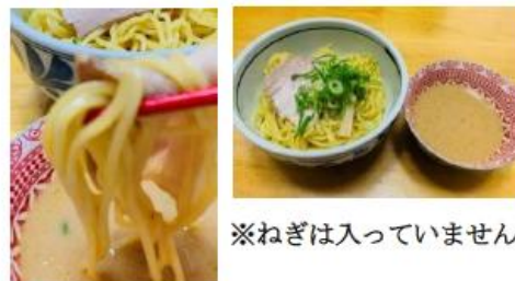
※ねぎは入っていません。

港生まれの魚介ラーメンから、つけ麺ができました。調理時間もレンジで5分以内でできて、手軽に食べることができました。麺がモチモチしていて美味しく、つけ汁も魚介の美味しさがストレートに味わえました♪