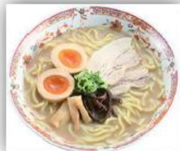
※玉子が入っていません。

動物性のダシのラーメンはちょっと苦手。魚介好きの私にはこんな自分向きのラーメンは初めてだと思いました。ふだんあまり濃いラーメンを食べない方にもぜひ！と思います。開発した支所の職員さんのオススメは、かつおぶしをかけて食べることです。