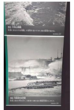
防災用品や、防潮扉、過去の港区での高潮被害写真の展示も。