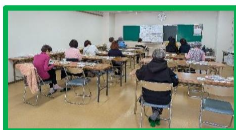
入退室自由に各自試食