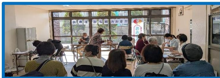
健康チェック、椅子に座って待機する列

都島地域活動委員会では パル委員を募集しています。コープ商品を囲んで学習 したり試食したりして楽しく活動しています。マイクロバスで見学に出かけたりしま す。小さなお子様連れの方や男性おひとりの参加也大歓迎です。 お問合せなど 詳しくは 裏面をご覧ください。