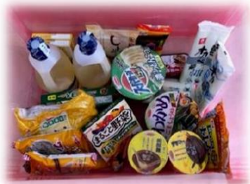
フードドライブ・ご提供ありがとうございました！