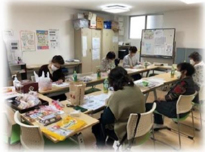
参加組合員さんと歓談・試食