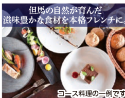
コース料理の一例です

※雲海期間(11/1~30)は5,000円/名UP ※上記は割引後の金額です。※上記は2名様1室ご利用時お一人様料金となります。※お1人様1室ご利用時10,000円追加 ※小学生:大人と同じお食事料金あり 大人と同料金、お子様ハーフコース料金あり1,200円、幼児:お子様プレート料金あり9,000円、お子様プレート添い寝・寝具なし5,400円、お食事なし寝具あり5,500円、お食事なし添い寝・寝具なし無料