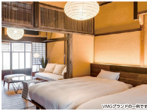
VMGブランドの一例です