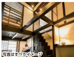
写真はすべてイメージ