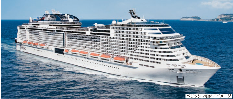
ベリッシマ船体/イメージ

※港務税他諸税US$ 290(目安:40,600円)は別途事前支払が必要です。(2022年12月15日現在) ※船内チップ(お1名様1泊につきUS$ 14.5)及び国際観光旅客税(1,000円相当をUS$換算)は含まれておりません。別途船内精算が必要となります。