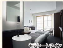
モデレートツイン