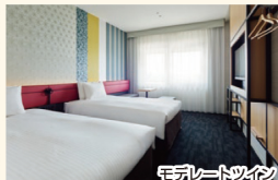
モデレートツイン