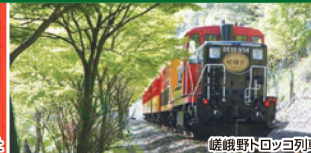
嵯峨野トロッコ列車