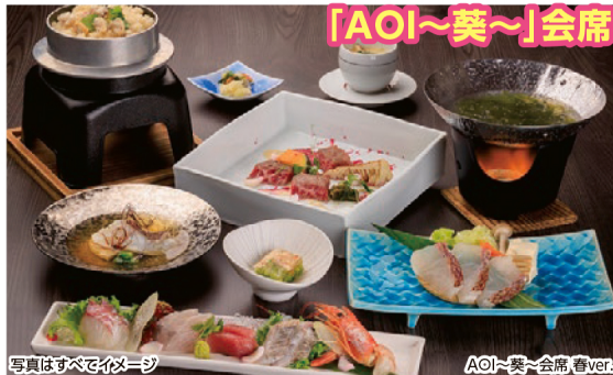
写真はすべてイメージ