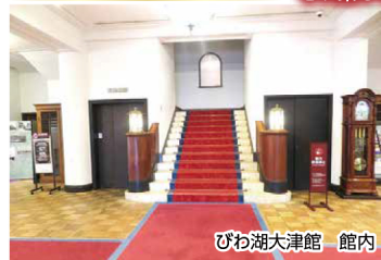
びわ湖大津館 館内