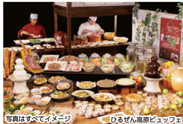
写真はすべてイメージ