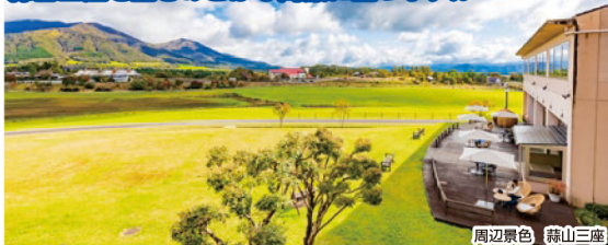
周辺景色 蒜山三座