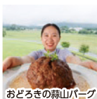
おどろきの蒜山バーグ