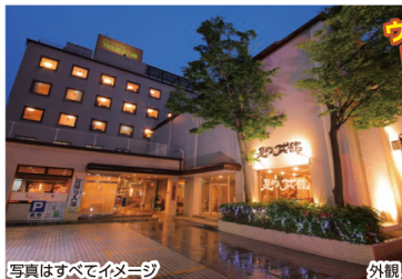
写真はすべてイメージ