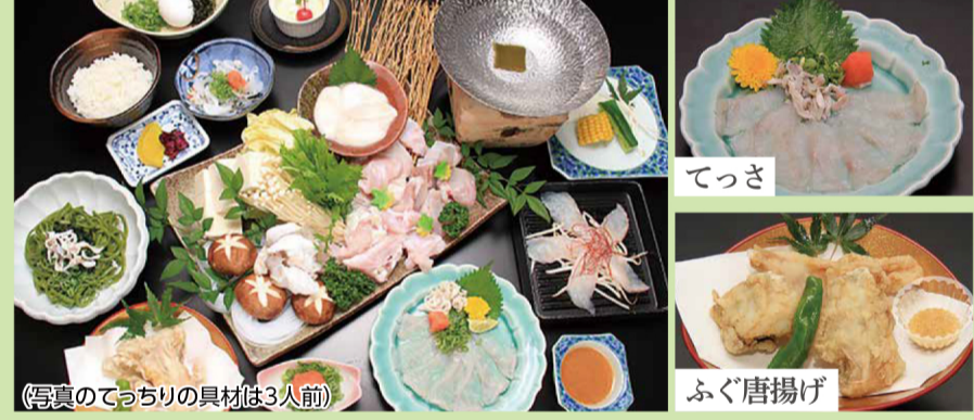
(写真のてっちゃんの具材は3人前)