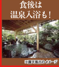
食後は温泉入浴も!

ランクアッププラン 下記旅行代金よりおひとり様2,500円増しにて、姿ガニを大サイズ(約600g)に変更します。さらにカニ鍋・焼きガニ・カニ刺しをたっぷり半身ずつご用意! ※出発10日前までの受付となり、旅行代金と合わせてご入金ください。 ※同グループ別々の受付不可。 ※姿ガニの通常サイズは約350g。