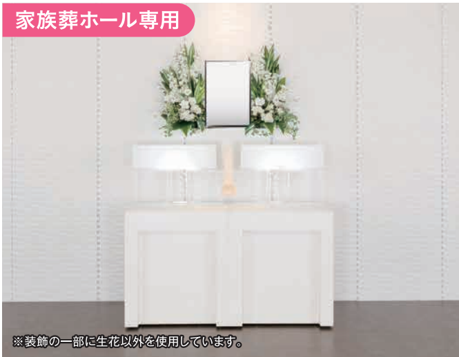
※装飾の一部に生花以外を使用しています。