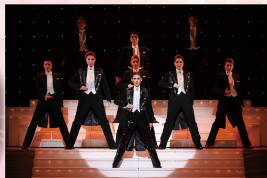
※写真はすべて2025年4月南座公演より