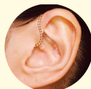
耳かけ型イメージ