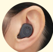
耳あな型イメージ