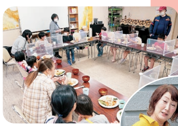
男性ボランティアさんや、門真市子ども政策課の職員さんもお手伝い