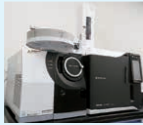
農業一斉分析装置 ガスクロマトグラフ 質量分析計 GC/MS/MS

農薬や化学肥料の使用割合を、生産地域の慣行栽培にくらべて3割以上減らし栽培された農産物のことを「ハート栽培農産物」といいます。