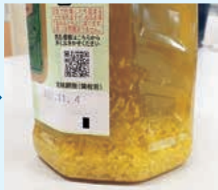
白い粒の沈殿が生じた オリーブオイル

オリーブオイルは水などの液体と同じように、低い温度になると固まることがあります。10℃前後で白い粒の沈殿が生じたり、白く濁ったり、固まったりします。これはオリーブオイルの成分の一部が固まって起きる現象です。