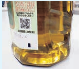
通常のオリーブオイル