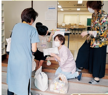
お米3キロと パン・レトルト食 品・お菓子などを お渡し