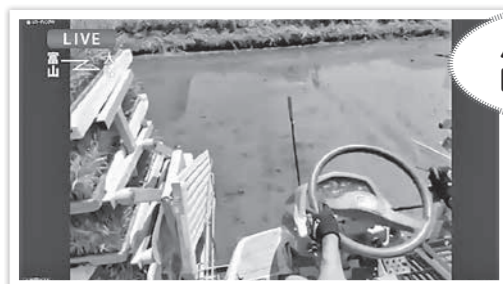
バーチャル 田植え体験

参加の組合員さんに事前に書いていただいた「自己紹介カード」で、「私のイチオシのご飯のお供」を発表。なかにはコロナ禍のおうち時間に漬けたお漬物を紹介される方も。