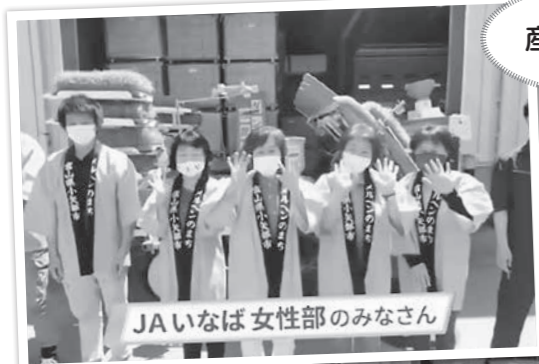
JAいなば女性部のみなさん