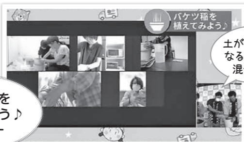
バケツ稲を 植えてみよう！ コーナー

臨場感あふれる“バーチャル田植え体験”。トラクターの目線で田植えの様子を生中継しました。