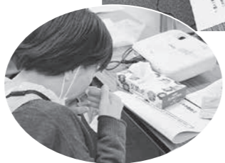
におい成分をふくませた物を嗅ぐ臭質識別トレーニング（写真左）

さまざまなにおいの表現の仕方を確認しました。嗅覚は個人差があり、これまでの経験や記憶が関係します。異臭と言われる中には、腐敗臭・塩素臭・酸臭・溶剤臭・泥臭など多数のにおいの種類があります。（左下図参照）