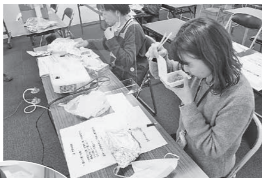
お申し出事例を再現した納豆の製品を嗅ぐトレーニング（写真上）さらに口を含むことで判断する