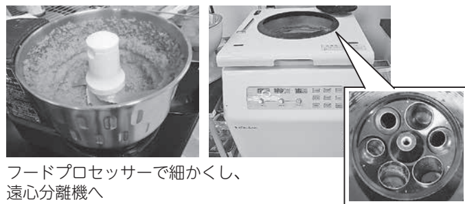
フードプロセッサーで細かくし、遠心分離機へ