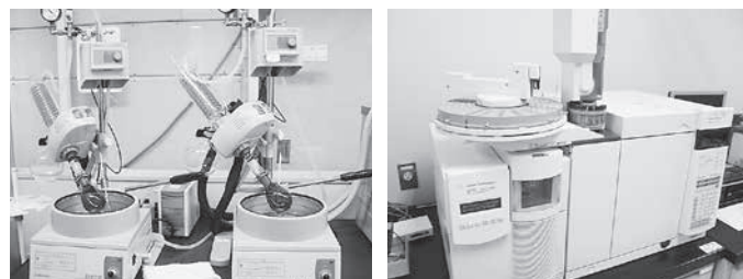
さらに濃縮し、精製。測定機にかけて分析します

パルコップでは、農産物を中心に、国の残留農薬基準や自主的な基準に適しているかどうかを確認しています（2019年度は819件実施）。