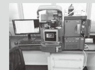
高速液体クロマトグラフ 質量分析計