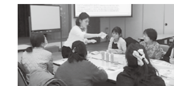
茨田西パル委員会「ナリス化粧品工場見学」(3月8日)