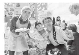
JAいなばの生産者さんと参加された組合員のお子さん、配達職員 (1月21日)