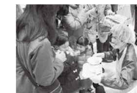
異製粉の「バーナードプレミアム食パン」をおすすめる配達職員 (2月18日)