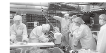
枚方香里地域活動委員会「JA全農ミートフーズ見学」(10月13日)