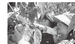
柿収穫体験ツアー (11月13日)