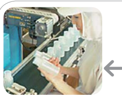
最後に容器が透明フィルムで圧着包装（シュリンク包装と言います）。その中に静電気で繊維状のものがないか人の目でチェックします