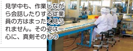
見学中も、作業しながら会話したりする従業員の方はまったく見られません。その姿は一心に、真剣そのもの