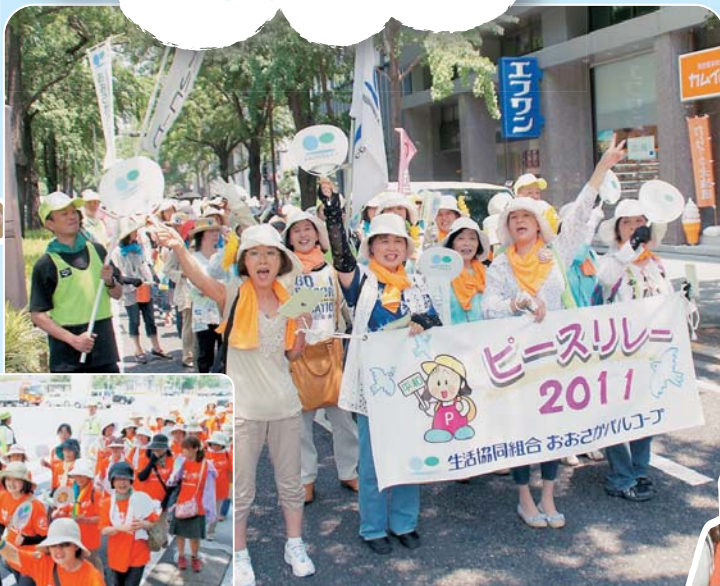
今年の先頭は大東地区のみなさん