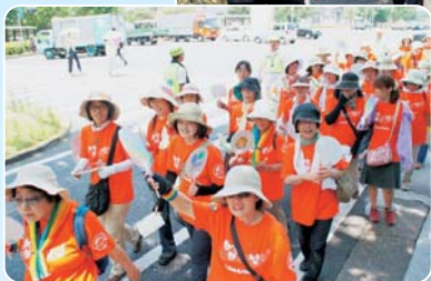
オリジナルデザインのそろいのオレンジTシャツで、歌ったり飛びはねたり元気いっぱい枚方地区のみなさん