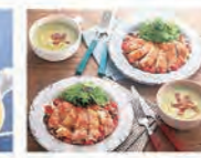
チキンソテーしめじとトマトのソース