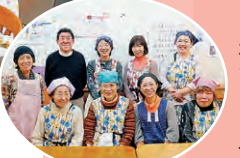
スタッフのみなさん

パルコープエリアにある「子ども食堂」を訪問し、活動の様子や運営されている方の思いなどを紹介します。今回は、住吉区にある「子ども食堂」に「よさみ」さんです。