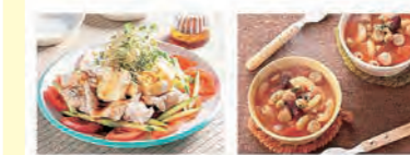
豆腐と豚肉のおかずサラダ

4月1日から産直一株トマトの予約がスタートしました。「え!もうそんな時期?!」という声が聞こえてきそうです...。ホームページでは、トマトの美味しい季節にぴったりなレシピを紹介しています。ぜひ参考にしてみてください♪