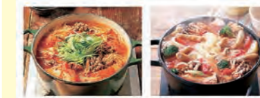
麻婆トマトキムチ鍋