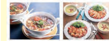
トマトと豆腐の酸味スープ