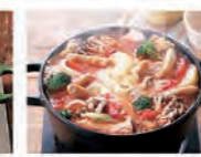
トマトみそチーズ鍋