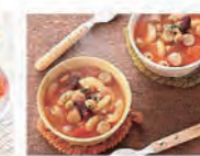
ウインナーとマカロニのトマトスープ