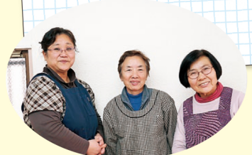
スタッフのみなさん