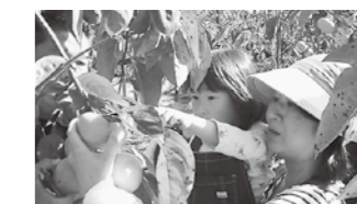
柿収穫体験ツアー (11月13日)