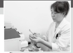
パルコープ 商品検査室 (卵鮮度検査)