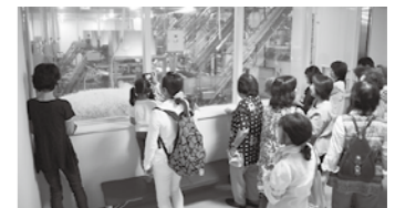
まきの地域活動委員会 「サラダコスモ もやし工場見学」 (7月23日)