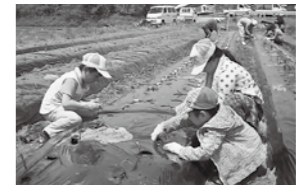
紀ノ川農協「親子農作業 連続体験ツアー (定植)」