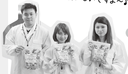
開発部の新人のみなさん